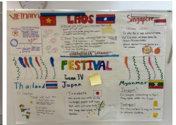
成果物（ベトナムチーム）