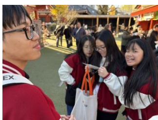
おみくじも引きました