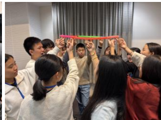
ヘリウムリングで交流！