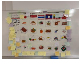
成果物（シンガポールチーム）