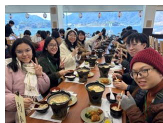
ほうとうにも挑戦!