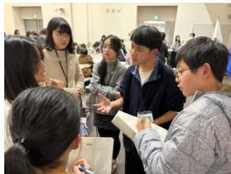
他国ハインタビュー

文化に関するテーマ（遊び、言語、食べ物、観光地、学校生活）を各グループに割り当て、各国の共通点や相違点についてまとめてポスターを作成しました。