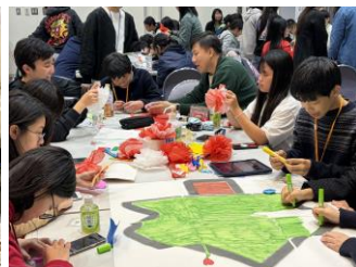
クリスマスツリー作成