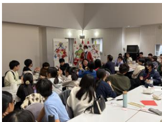
サンタクロスが出現

2日目は、サンタクロスから謎解きミッションが発生しました。英語のクロスワードやダンス動画撮影を行い、最後はクリスマスツリーを作成しました。