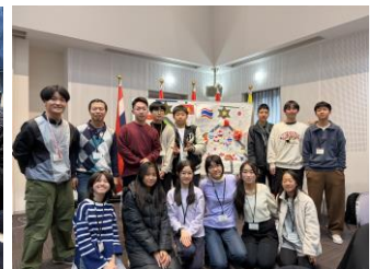
チームごとに記念撮影