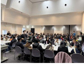
全国各地から集まりました

NIYEのスタッフが進行し、各国に関連した○×クイズや自己紹介ゲーム、体を動かすレクリエーションを行いました。最初は緊張していましたが、一緒に体を動かすことで徐々に会話が増えていきました。