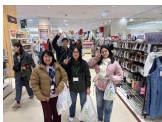
買い物体験の様子