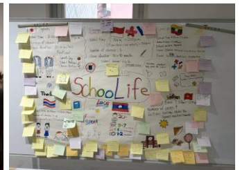
成果物（ラオスチーム）