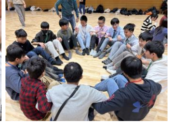
息を合わせてスタンドアップ！