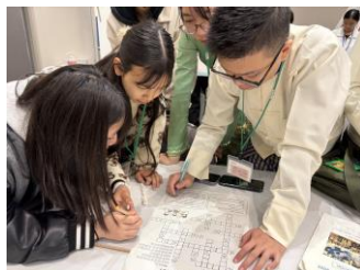
クロスワードミッションに挑戦