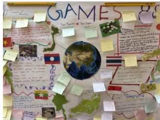
成果物（ミャンマーチーム）