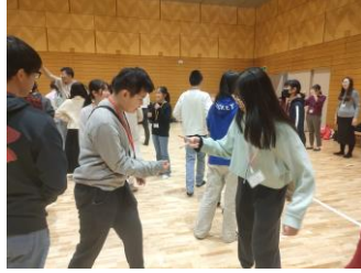
じゃんけんて自己紹介！