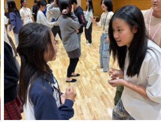
少しずつ会話も増えました