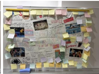
成果物（タイチーム）