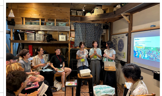
ボランティアについて理解を深める！