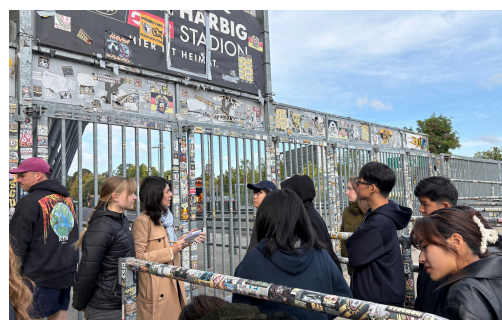
ドイツのボランティアについて話を伺う