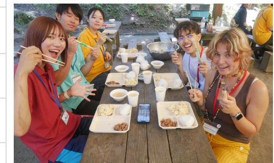
曾爾ボランティアと野外炊事！