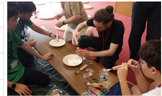
木のスプーンフォーク作りに挑戦！