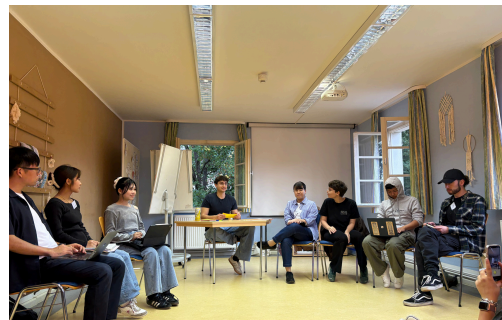
合宿セミナーでドイツ団と意見交換！