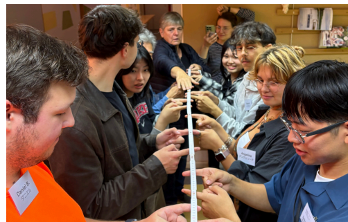
ドイツ団とのアイスブレイクで盛り上がる