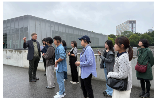
ベルリン市内を見学し歴史を学ぶ！