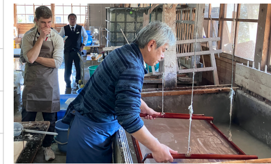
手漉き和紙職人の技を目の当たりにする