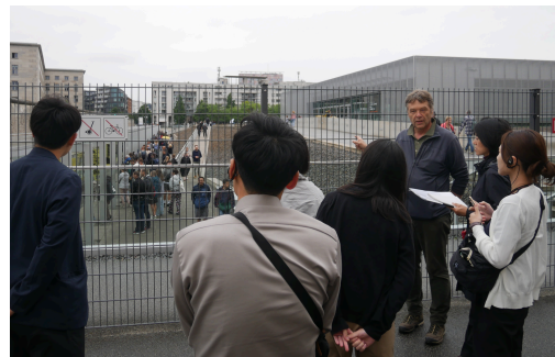
ベルリンの壁を見学し歴史を再認識