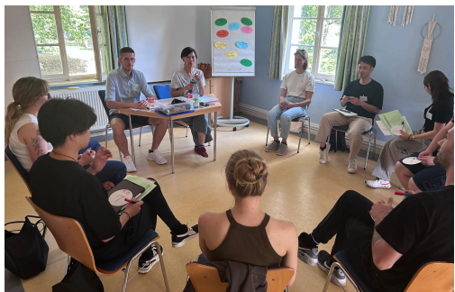
合宿セミナーでドイツ団と意見交換