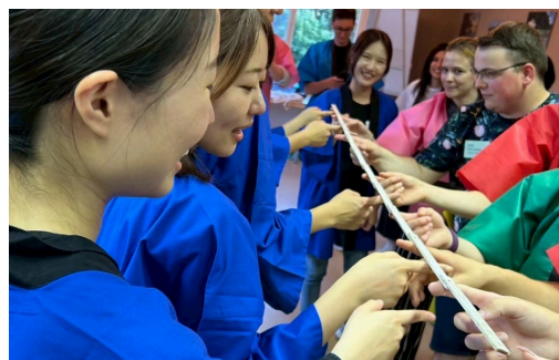
ドイツ団とのアイスブレイクで盛り上がる