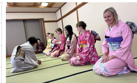
茶道体験！正座にもチャレンジ