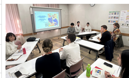
働き方について若手社員との意見交換