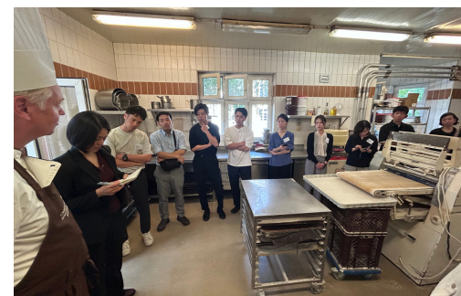
ドイツの手工業について話を伺う