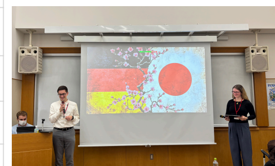
学習成果発表会で2週間の学びを報告