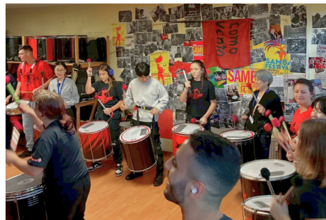
座学だけではなく、体験も大切です