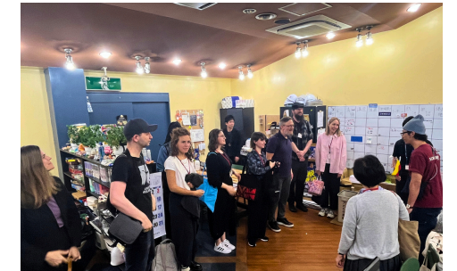
青少年支援の現場を視察