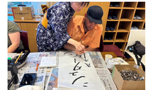
子どもたちとの交流も魅力のひとつ