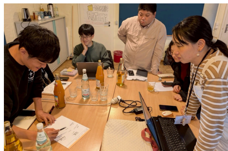
団員同士で学びと思いのシェア