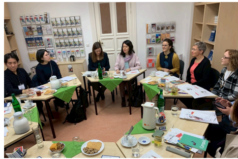
ドイツの青少年支援団体と質疑応答