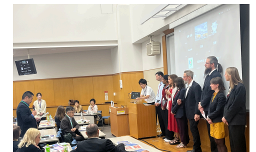
2週間の成果をプレゼンテーション