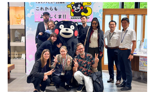
東京と地方、両方の取組を学べる