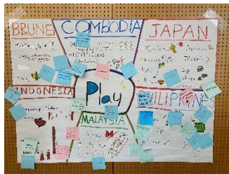
成果物（インドネシアチーム）