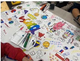
カラフルなポスターができあがります