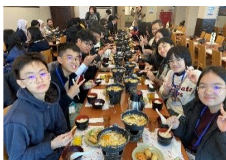
ほうとうも食べました