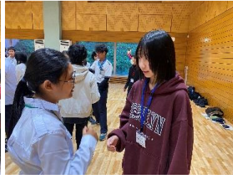
少しずつ会話も増えました