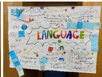
成果物（マレーシアチーム）