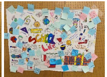
成果物（フィリピンチーム）