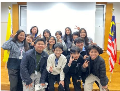
グループ⑤ フィリピンチーム