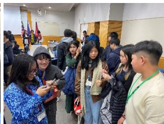
2日間でみんな仲良くなりました