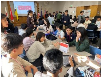
ディスカッションの様子

1日目の後半からは、グループリーダーの東京学芸大学のボランティアの皆様がプログラムを担当してくださいました。文化に関するテーマ（遊び、言語、食べ物、観光地、学校生活）を各グループに割り当て、各国の共通点や相違点についてまとめてポスターを作成しました。