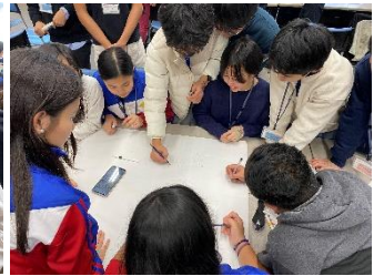
ポスターに書き出します