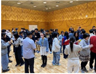
英語で自己紹介しています