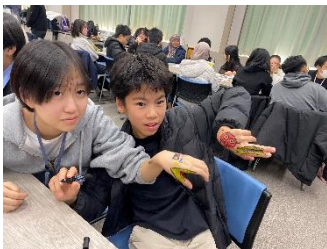
もう打ち解けています