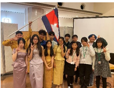
グループ② カンボジアチーム