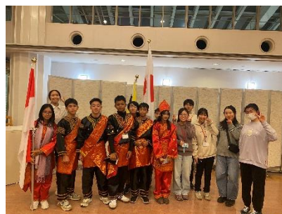
グループ③ インドネシアチーム