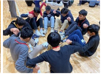
息を合わせてスタンドアップ!