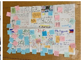
成果物（ブルネイチーム）