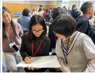
インタビューの様子②