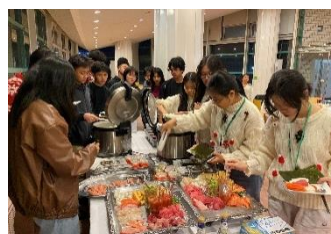
手巻き寿司も体験しました