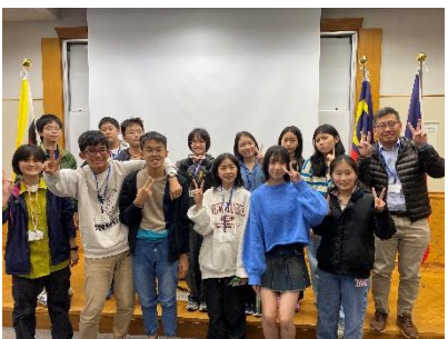
グループ④ マレーシアチーム