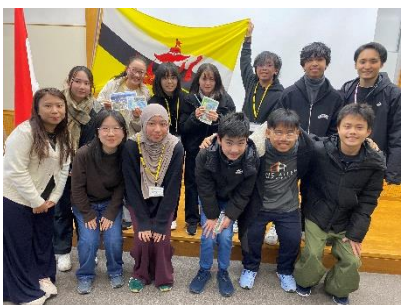
グループ① ブルネイチーム