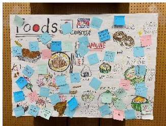
成果物（カンボジアチーム）