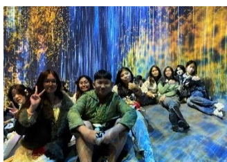
チームラボの様子