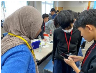
インタビューの様子①